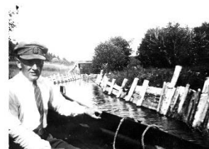
Verko förnämnen Renset. Bått.